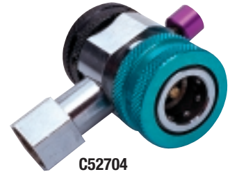
C52704 R-134a Purge-Mate Acoplador del lado de baja con botón de purga. Simplemente oprima el botón para purgar el aire.