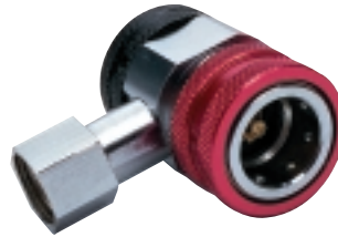
C52701 R-134a Purge-Mate Acoplador del lado de alta sin botón de purga.