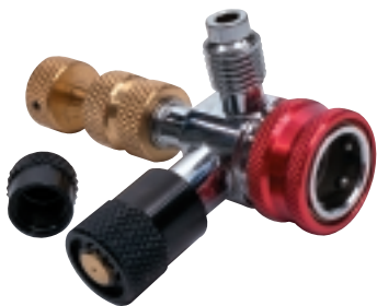
C52801 Purge-Mate Extractor del núcleo de válvula del lado de alta con puerto lateral

Una mirada a la nueva línea de herramientas PURGE-MATE para la remoción del núcleo de la válvula, le convencerá que está viendo algo especial. No solamente han sido diseñadas para ocupar menor espacio que las herramientas actuales sino que al mismo tiempo tienen un aspecto excelente. Pero la belleza real radica en su uso. Ejes que se mueven suavemente, mordazas que pueden sujetar con limpieza y firmeza a sus válvulas. Asas que dan la sensación correcta. Al igual que con todas las herramientas PURGE-MATE que se acoplan a un puerto de servicio, busque la conexión especial de 8 bolas para sujeción y estabilidad adicionales.