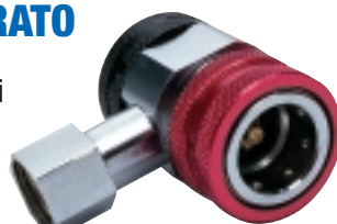
C52701 Raccordo per il lato ad alta pressione R-134a Purge-Mate senza pulsante di disaerazione.