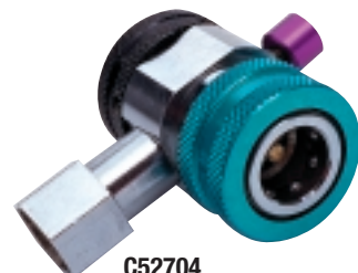
C52704 Raccordo per il lato a bassa pressione R-134a Purge-Mate con pulsante di disaerazione. Basta premere il pulsante per spurgare l'aria.