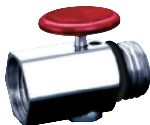
C52503 Purge-Mate Raccordo da 14 mm per disaerazione